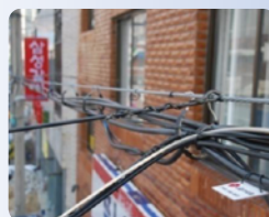
A. 설치 할 곳 확인