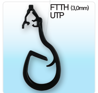
FTTH (3.0mm) UTP