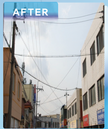
인입선 행거 : 광주전남본부시범적용